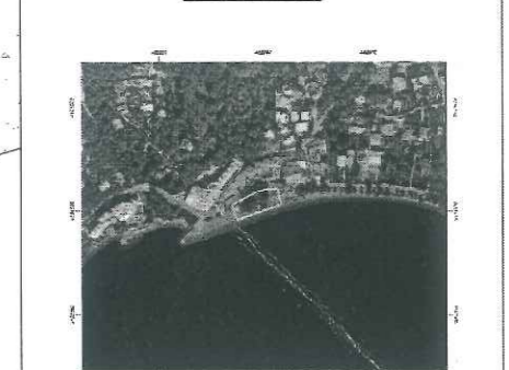
ΑΠΟΣΠΑΣΜΑ ΟΡΘΟΦΩΤΟΓΡΑΦΙΑΣ ΤΗΣ ΕΚΧΑ Α.Ε.